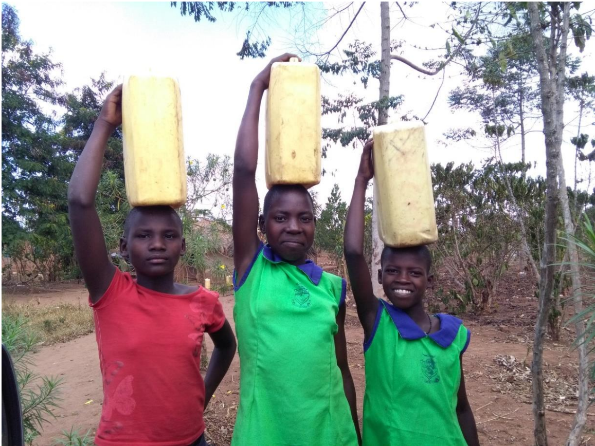
Stichting Moving werkt al 14 jaar in Oeganda voor kinderen